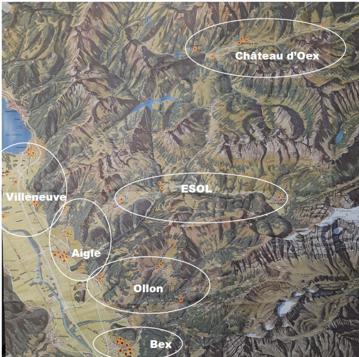
Carte 1 : Localisation des établissements de la région scolaire des Alpes vaudoises