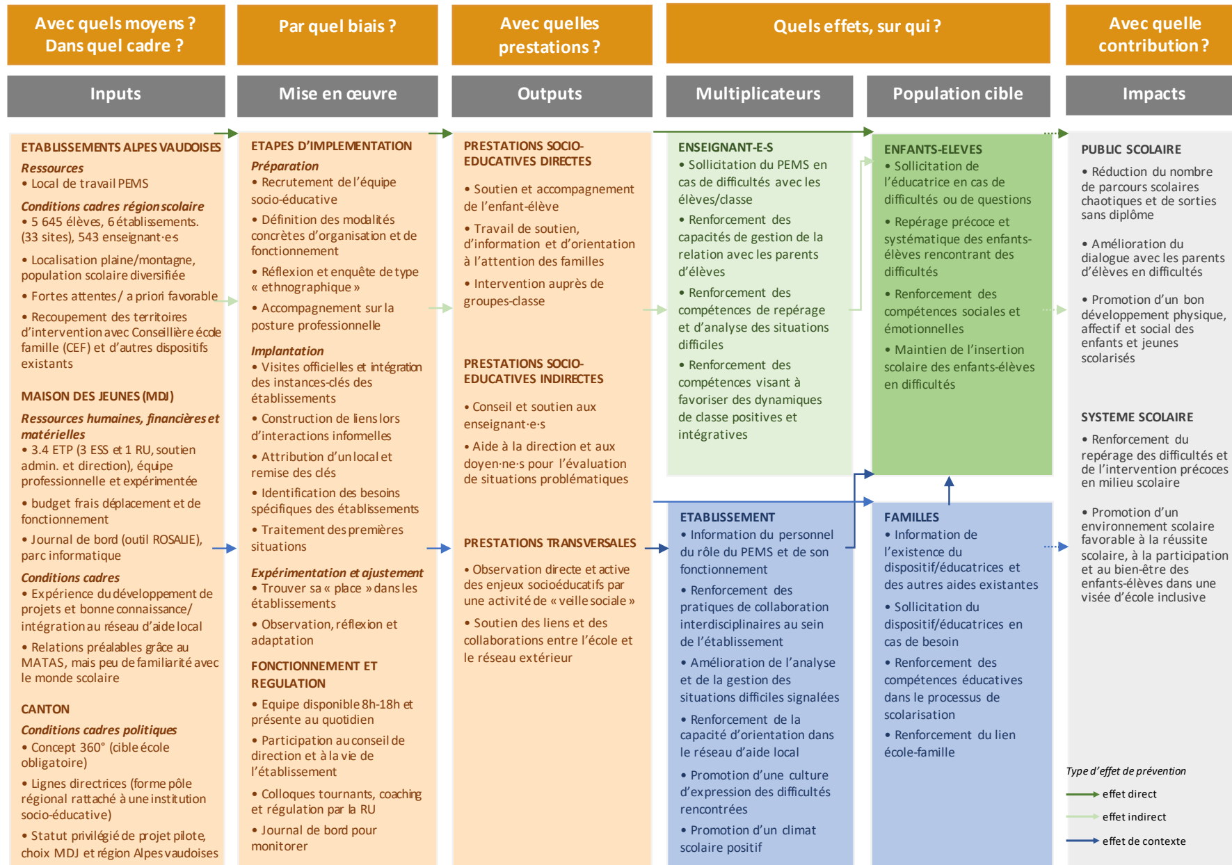
Figure 1 : Modèle d'impact du PEMS